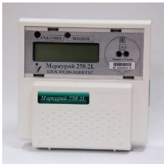
Рисунок 1 - Внешний вид блока индикации PLC

Внешний вид блока индикации PLC приведён на рисунке 1.