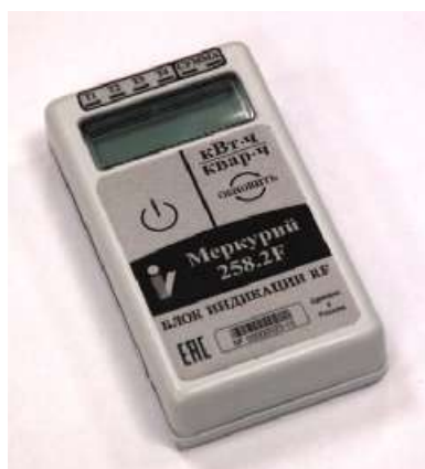
Рисунок 2 - Внешний вид блока индикации RF

Внешний вид блока индикации RF приведён на рисунке 2.