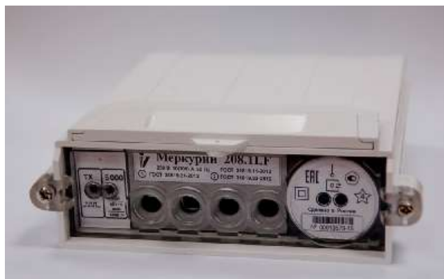
Рисунок 3 - Внешний вид блока счётчика

Счётчики представляют собой специализированное микрокомпьютерное устройство, в котором все основные функции реализованы с помощью внутреннего программного обеспечения.